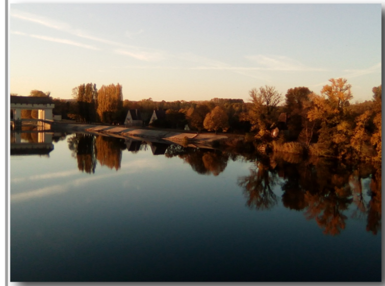
Parc du Rhône